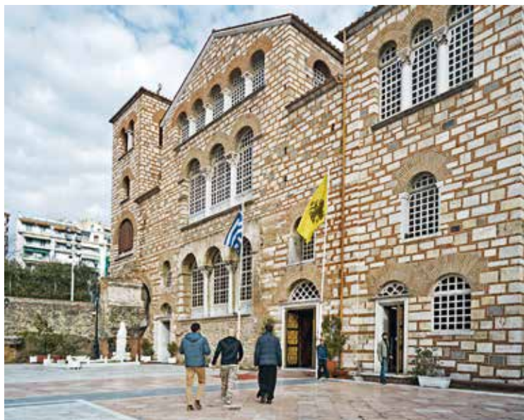
Идем в базилику вмч. Димитрия Солунского

Более двух часов продолжался наш пеший поход во второй афонский монастырь нашего маршрута — Ватопед. Там монахи встретили нас достаточно ядреным раки. Местный спиртной напиток. Бодрит, однако! Удивились, что забыл «грек» в группе паломников из Москвы. Именно за своего соотечественника принял меня архондаричный монах, со слов и перевода отца Сергия. «Архондариком» называется приемная комната для гостей афонских монастырей. После вечернего богослужения мы первые вошли в трапезную и последние ее покинули. Уж слишком богатый и вкусный стол был в тот вечер в Ватопеде в честь праздника местного святого, как потом оказалось.