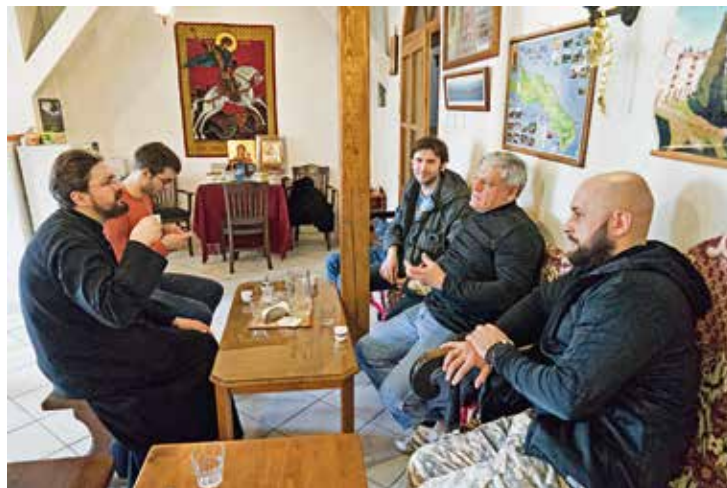
В архондарике монастыря Зограф

Вся наша дружная братия из 6 человек стала счастливыми обладателями димитрионов, которые являются визами, если хотите — внутренними паспортами паломников непосредственно на Афоне.