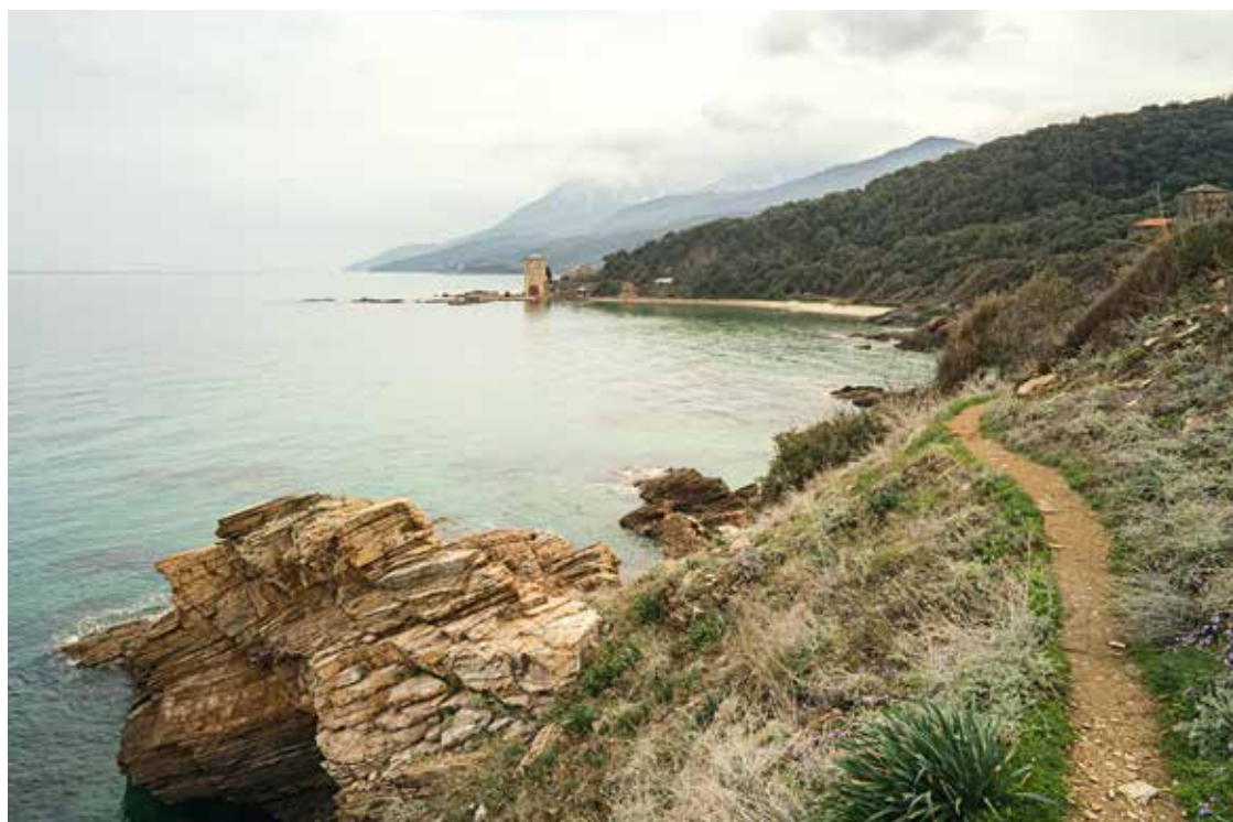
На пути в Иверон

В монастыре Симонапетра мы приложились к мощам, руке Марии Магдалины. «Эта рука прикасалась к Самому