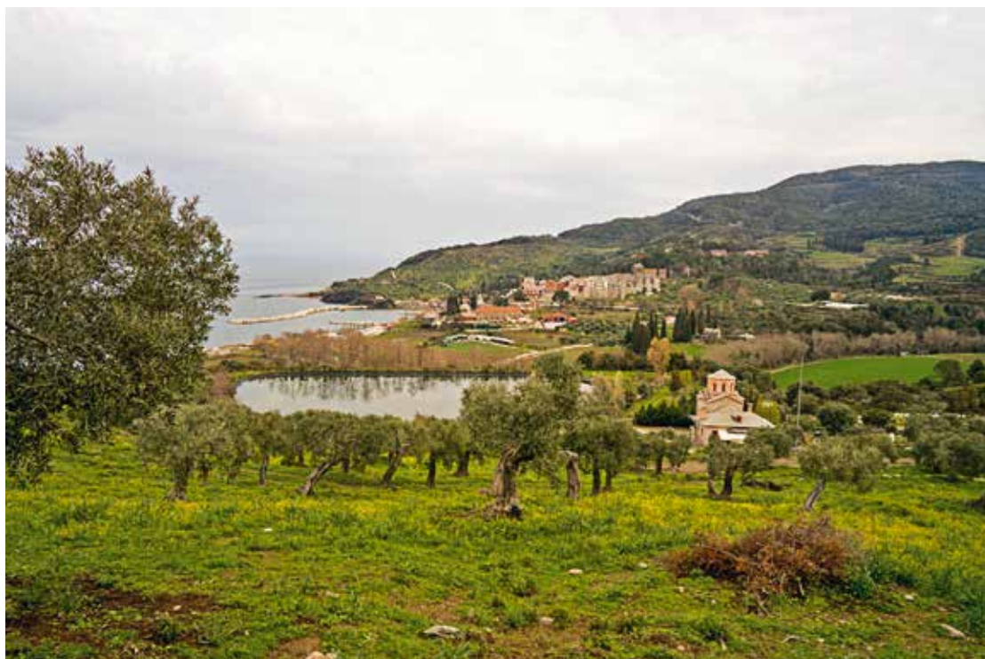
Подходим к Ватопеду

Неудобно было просто так уйти с трапезы последними, и мы твердо решили помочь монахам. После четкого и подробного инструктажа со стороны монахов убрали пищевые крошки, пополнили запасы салфеток и воды на столах.