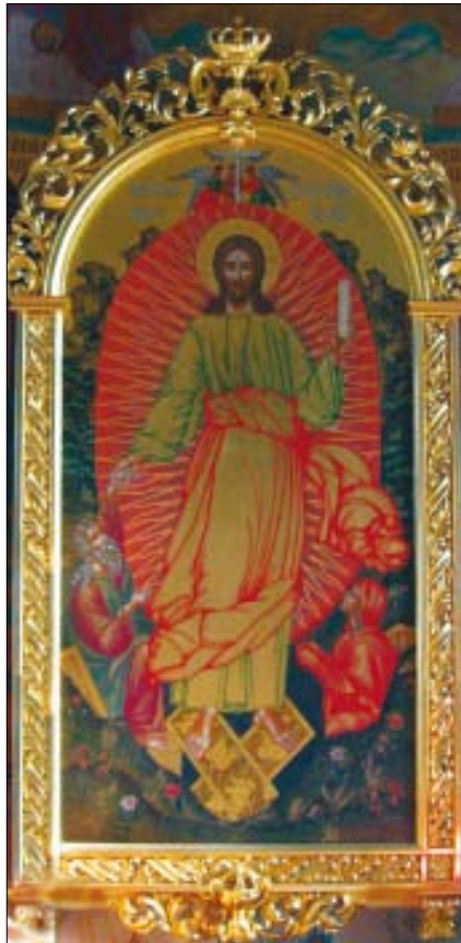
Воскресение Христово. Икона из алтаря нашего храма

Но есть другой день, известный нам и особенно прославляемый, — тот день, о котором Апостол говорит: яко во дни благообразно да ходим. День обычный сопровождается восхождением и захождением солнца. А в сей, другой, день сияет в сердцах верующих Слово Божие и прогоняет тьму не от плотских очей, а от души: тьму злых нравов. Сей-то день и почитим, в этот день да возвеселимся. Будем внимать словам святого Апостола: все вы — сыны света и сыны дня: мы — не [сыны] ночи, ни тьмы (1 Фес. 5, 5); как днем, будем вести себя благочинно, не [предаваясь] ни пированиям и пьянству, ни сладострастию и распутству, ни ссорам и зависти; но облекитесь в Господа нашего Иисуса Христа, и попечения о плоти не превращайте в похоти (Рим. 13, 13–14). Если это правило вы исполняете, то всем сердцем воспевайте: сей день, егоже сотвори Господь . Ибо что воспевайте, тем вы и бываете, если проводите благую жизнь. Но