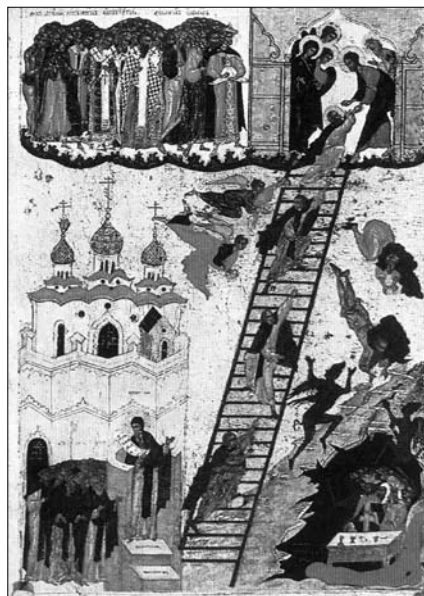
Икона «Лестница». Россия, XVI в.

За праздником Входа Господня в Иерусалим следует Страстная неделя. Страстная седмица – это уже не пост, а цель поста. Мы участвуем в последних днях жизни Спасителя. И ожидаем Светлого Христова Воскресения – Пасхи Господней!