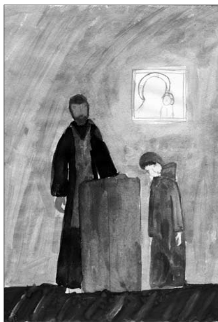
Рисунок ученика Воскресной школы

Наступил вечер. Сумерки колыхнулись от звона к великому по-вечерию. Всей семьей мы пошли к чтению канона Андрея Критского. В храме полумрак. На середине стоит аналой в черной ризе, и на нем большая старая книга. Много богомольцев, но их почти не слышно, и все похоже на тихие деревца в вечернем саду. От скудного освещения лики святых стали глубже и строже.