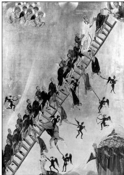
Икона «Лествица». Синай, XII в.

Скрывая свои подвиги от людей, преподобный Иоанн иногда уединялся в пещере, но слава о его святости распространилась далеко за пределы места подвигов. В возрасте 75 лет преподобный был избран игуменом Синайской обители. Около четырех лет управлял преподобный Иоанн Лествичник святой обителью Синая. Во время управления монастырем по просьбе святого Иоанна, игумена Раифского монастыря, и была написана преподобными знаменитая «Лествица» – руководство для восхождения к духовному совершенству. Зная о мудрости и духовных дарованиях преподобного, Раифский игумен от лица всех иноков своей обители просил написать для них «истинное