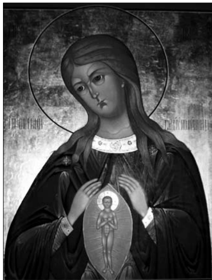
«Помощница в родах»

Рядом с этой иконой висит небольшая икона Божией Матери «Всецарица». Чудотворный образ XVII в. «Всецарица» («Пантанасса» – по-гречески «Всегоспожа, Всеповелительница») находится на святой горе Афон в соборном храме Ватопедского монастыря. В древности у этого образа раскаялся и исцелился юноша, занимавшийся оккультизмом и потому одержимый бесами. Позже этот образ прославился многочисленными чудесами исцелений от необычайно распространенных в современном мире онкологических заболеваний. Чтимый список с древней чудотворной иконы, изготовленный в Ватопедском монастыре, находится в Московском Новоспасском ставропигиальном мужском монастыре. Еще один список был передан в храм Всех