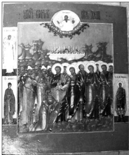
«Исцеление кровоточивой жены»

В нашем храме стараниями настоятеля и прихожан собрание икон постоянно умножается. Постепенно в храме складываются молитвенные уголки, где с насущной просьбой можно обратиться к Богу у святых образов. Так, у иконы с частицей мощей Вифлиемских младенцев и у Феодоровской иконы Божией Матери мы молимся об исцелении детей.