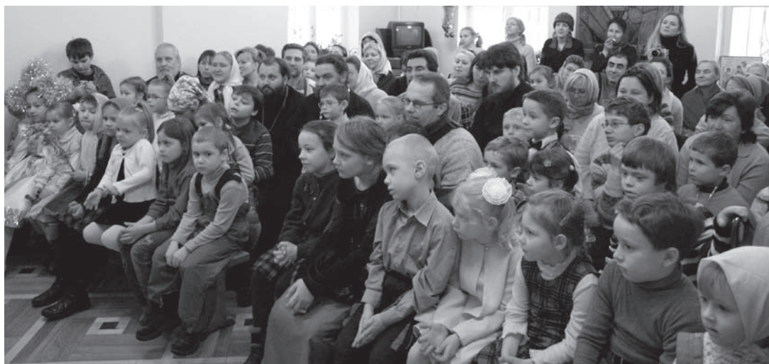
Гости, учителя и учащиеся воскресной школы во время спектакля «Рождественские подснежники» (сценарий Екатерины Ивановны)