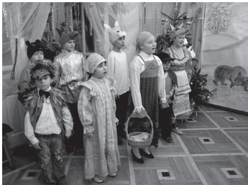
Лесной хор исполняет рождественские колядки