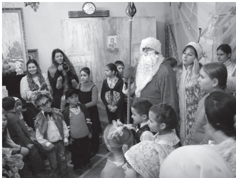
Дед Мороз и Снегурочка на празднике в воскресной школе