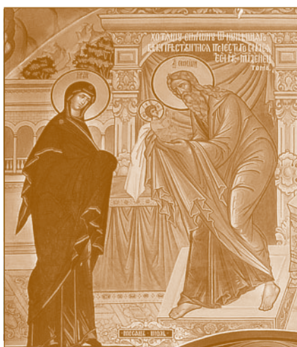
Фрагмент росписи нашего храма

Всем нам открыта встреча как радость; но не все в эту радость вступают. Сегодня мы вспоминаем