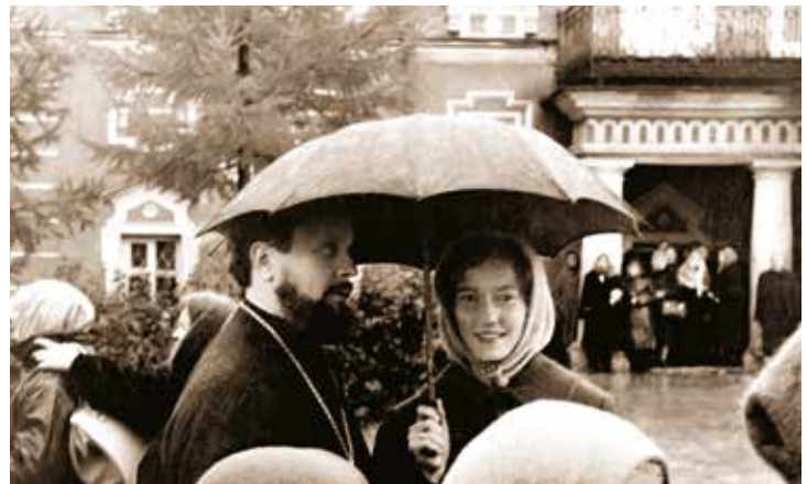
В Троице-Сергиевой Лавре