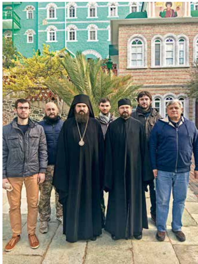
С владыкой Феофилактом Пятигорским в монастыре вмч. Пантелеимона перед отправлением в обратный путь

Стасидии (сидячие места-кресла по периметру афонских монастырей) во время длительных монастырских служб реально спасительны. Как для ног, так и для сознания молящихся. Лично я не отказался бы от таких и в московских приходах. На протяжении нескольких дней вполне себе реально вставать в 3–4 утра, если знаешь, зачем ты просыпаешься. Например, на встречу с Богом во время ночного богослужения в афонском монастыре. Аминь!